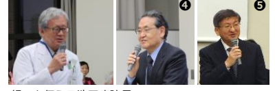
想いを伝える池田病院長